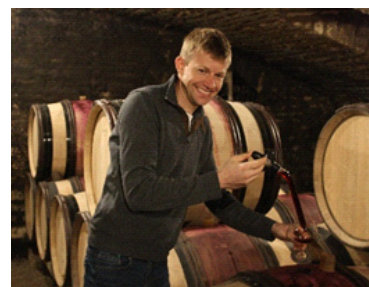
ブルゴーニュ アリゴテ 2021 Bourgogne Aligoté