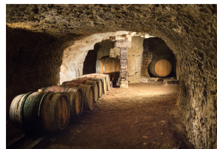
貯蔵トンネルの「トログロディット」